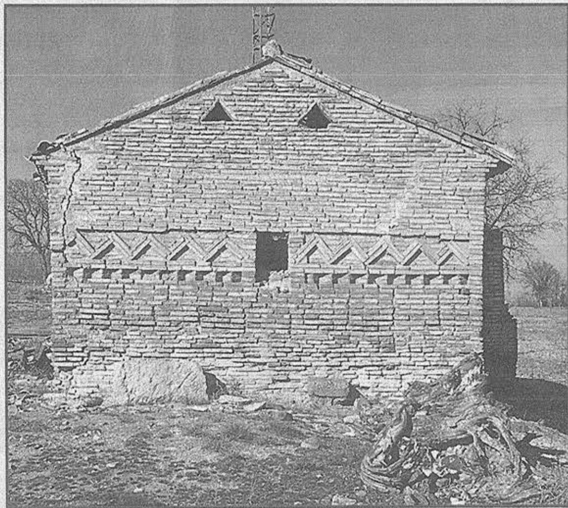
En la imagen superior, la ermita de Gañarul vista desde el sureste; a la izquierda, fachada oriental de la ermita; abajo, detalle de la decoración de esta singular joya arquitectónica del mudéjar aragonés, y una vista de la ermita de la localidad zaragozana desde el sur

una réplica de la imagen titular. Así se recuperarían en una sola acción una bella muestra de nuestro patrimonio arquitectónico y una pieza más de ese patrimonio inmaterial que es la ro-