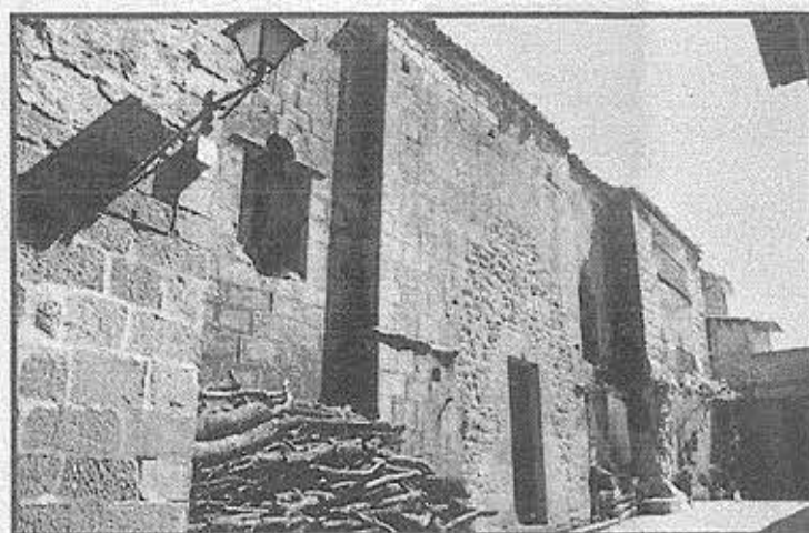
Debajo, a la izquierda, estado actual de la fachada meridional de San Miguel, emplazamiento original de la portada; a la derecha, detalle del capitel que representa el «sacrificio de Isaac»

Sus tres arquivoltas utilizan la moldura de toro que cubre la arista del arco, partiendo de ésta manera los cuerpos de las figuras representadas. Los temas representados pueden agruparse en: geométricos (ajedrezado y labor de cestería), vegetales (hojas de acanto junto a bolas, hojas palmeadas y roleos), animales (leones, cervatillos y aves) y humanos (hombres bebiendo o haciendo la burla, representación de sacamuelas y paciente, juglares, luchas entre hombres y animales, cazadores y soldados con diferente armamento). El tímpano, o parte central, está delimitado por una cenefa de palmas y sostenido por dos ménsulas con cabezas de monstruos, dirigiendo la atención de los fieles al tema elegido donde San Miguel, rescatador de almas, disputa la de un difunto al demonio, constituyendo ello una rareza iconográfica, mayor por el hecho de asociarse a la presencia de un crismón. Los capiteles en los que apoyan las arquivoltas se encuentran muy degradados, pudiéndose distinguir únicamente con claridad una representación del «Sacrificio de Isaac».