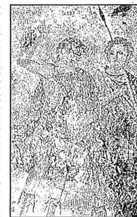
Junto a estas líneas, un detalle de una de las piezas excavadas y, debajo, el ángulo superior derecho del mosaico de Cadmo

Comisión de Educación y Difusión de Acción Pública para la Defensa del Patrimonio (APUDEPA).