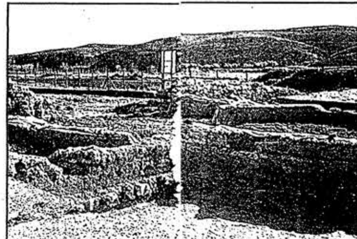
En las fotos de arriba, el emblema central que figuran las bodas de Cadmo y Harmonía y una parte del ángulo inferior derecho del mosaico. Sobre es tas líneas, vista de La Malena

Es la imagen simbólica de la armonía del universo, justificada tanto por la presencia implícita de los invitados como por el pensamiento pitagórico en el que cada número se identifica con una cualidad esencial: el uno es lo masculino, el dos lo femenino, así